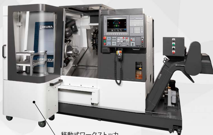
移動式ワークストッカ