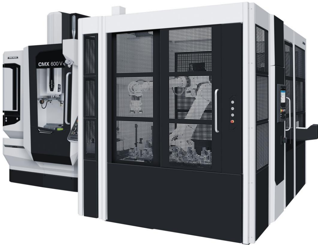
CMX 600 V + MATRIS (外觀)